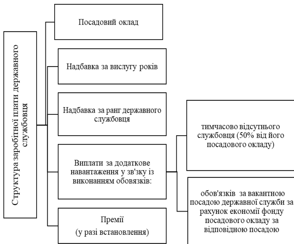
Рис. 1. Структура заробітної плати державного службовця в Україні

Під час проведення аналізу системи, методів та інструментів стимулювання персоналу в Управлінні Держпраці в Сумській області було виявлено неефективне їх «міксування» та застосування, що пов'язано насамперед із відсутністю чітких критеріїв оцінки мотивованості службовців як об'єктивної бази для розроблення системи стимулів.